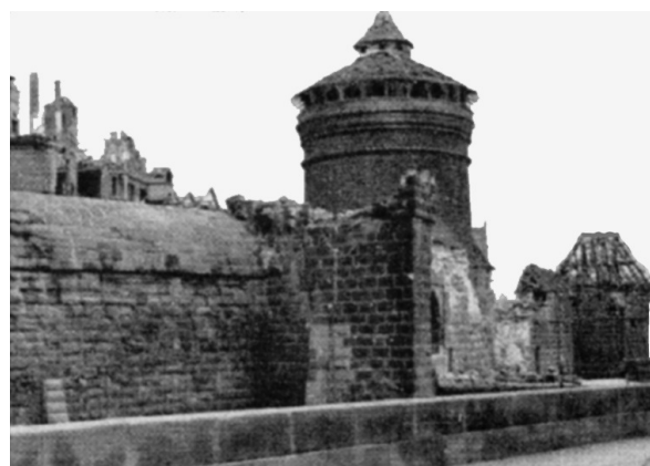
Frauentor, Waffenhof, Königstor, April 1945

n-lite #5: 04/1945: DIE AMIS KOMMEN! Verlag testimon 2020, 32 S., DIN A 5, mit 3 Farb- & 6 Schwarzweißabbildungen, 5 EUR (zzgl. 1,55 EUR Porto). Nur zu beziehen über: info[at]testimon.de