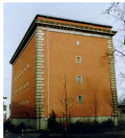
Bauliches Relikt aus dem Luftkrieg: Hochbunker Steinerstraße 3, 2004

Bei Kriegsbeginn am 1. September 1939 war die Stadt auf potentielle Luftangriffe völlig unzureichend vorbereitet: Obwohl bereits 1937 aus einem das Reichsgebiet unter Luftkriegsaspekten klassifizierenden Gefahrenzonenplan hervorging, dass München durch seine Nähe zur Landesgrenze und seine leichte Auffindbarkeit für die Bomber als besonders luftgefährdet zu gelten hatte, waren nach einer amtlichen Zusammenstellung vom 26.10.1939 von den 169 geplanten öffentlichen Luftschutzräumen erst 34 fertiggestellt.