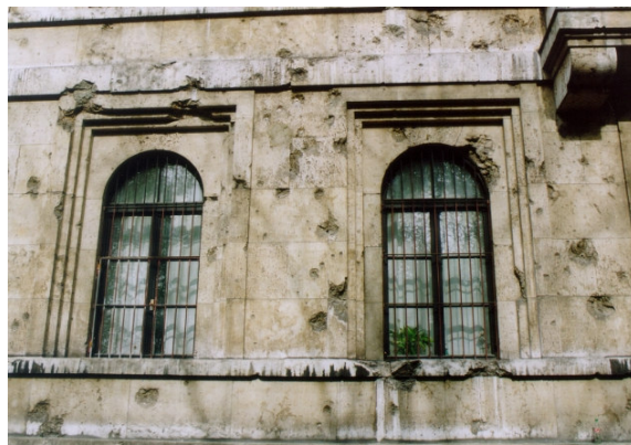
Spuren im Stein: Splittereinwirkung an der Rückseite des ehemaligen „Verwaltungsbaues“ der NSDAP am Königsplatz, 2004

Ein Doppelangriff der RAF am 07./08.01.1945 mit insgesamt 597 Bombern, von denen 16 nicht zurückkehrten, kostete noch einmal annähernd so vielen Menschen (505) das Leben. Sein Schwerpunkt war die Gegend zwischen Hauptbahnhof und Ludwigstraße, in der u.a. das „Braune Haus“ an der Brienner Straße zerstört wurde.