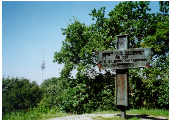
Gedenkkreuz auf dem Schuttberg im Luitpoldpark zur Erinnerung an die Bombentoten, im Hintergrund der Olympiaturm, 2004