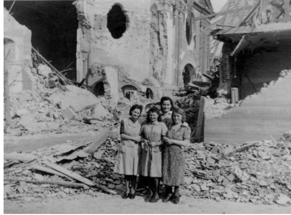
Mitarbeiterinnen der Firma Konen vor den Ruinen der St. Wolfgangskirche, 1944