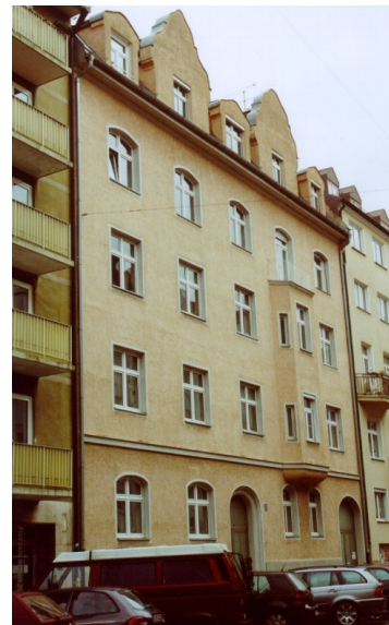
Halbruine des Anwesens Hiltenspergerstraße 6 in der Maxvorstadt (vorne die Gleise der „Bockerlbahn“) 1944 und nach dem Wiederaufbau 2004.