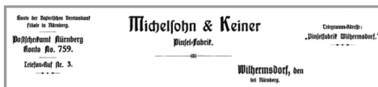
Briefkopf der Pinselfabrik Michelsohn & Keiner